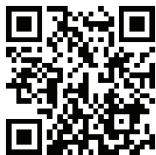
Peter Gabriel Sledgehammer