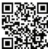
Train Drops of jupiter