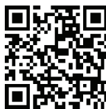
Tom Waits I Hope I Don't Fall in Love With You